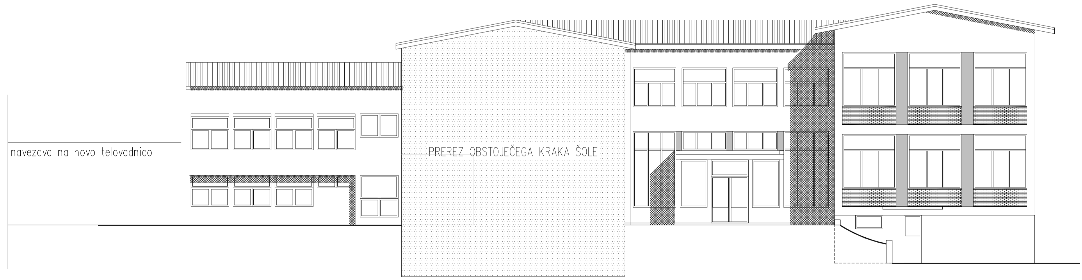
ZAHODNA FASADA (IZSEK)