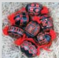
Belokranjske pisanice

Takšna tehnika barvanja pisanic je bila zame velik izziv, sploh po skromnih navodilih, ki sem jih dobila zraven pisalke. Zato ti preostane le samo učenje in izkušnje pri uporabi batik tehnike ali pa nasveti katerega izmed izdelovalcev belokranjskih pisanic – Nade Cvitkovič, ki vsako leto okoli velike noči predstavi