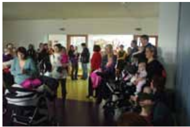
Obisk staršev s svojimi otroki

Končno je zapadel tudi sneg in lahko smo izpeljali smučarski tečaj na Pohorju. Udeležilo se ga je kar veliko otrok, ki vrtec obiskujejo zadnje leto. Izvajal ga je »Smučarski klub Branik«. Vsi otroci so osvojili osnove smučanja. Zadnji dan je bila tekma in veliko staršev je prišlo gledat svoje otroke. Otroci so za prevoženo proggo, na kateri so jih spodbujali starši, prejeli pokal. Otroci in starši so bili zadovoljni. Ob koncu januarja so nas obiskali starši z otroki, ki so se rodili v letu 2011 in bodo nekateri že letos z novim šolskim letom prišli k nam v vrtec. Razkazali smo jim vrtec in pogledali so si lahko dejavnosti, ki so se takrat odvijale. Naš pevski zborček jim je zapel nekaj pesmic za dobrodošlico. Zelo jim je bilo všeč, seveda so jih najbolj zanimale jasli. Bilo jih je veliko, tako da bomo imeli v novem šolskem letu zopet poln vrtec. V tem šolskem letu izvajamo projekt »NMK – naša mala knjižnica«, zato smo teden, v katerem je bil kulturni