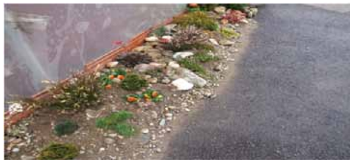
Slika prikazuje vzorec moderne gredice, ki se lahko poljubno dopolnjuje in po želji spreminja.

cam, lahko so obogatene s skupinami enoletnic, ki poživijo posamezne točke gredice. Zasute so s kamni oz. z lubjem, kar je bolj prilagojeno okolju. Takšne gredice so seveda ob vzpetinah lahko podkrepjene s kamni. Kamne prekrivajo velikonočnice, trave, planinke in ostale cvetlice, ki potrebujejo malo vlage in veliko sonca. Nega teh rastlin je preprosta, saj potrebujejo striženje po potrebi (grmovnice po cvetenju), enoletnice pa zamenjavo z novimi, tako da je sklop vedno popoln.