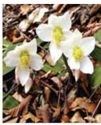
Trobentice, takšne, kot so jih poznale naše babice, pa vse do hibridnih sort in spomladnega teloha.