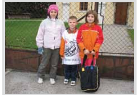
DROBTINICA, Svetovni dan hrane (izkupiček gre za kosila socialno šibkih šolarjev).