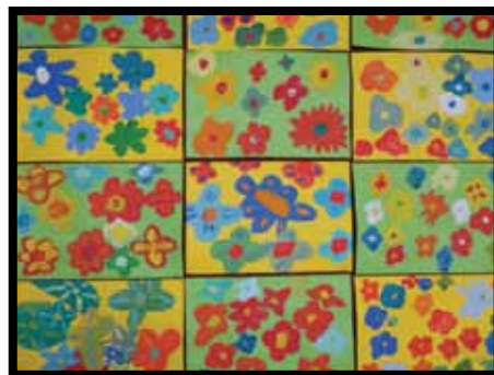
Učenci 2. b-razreda OŠ Borisa Kidriča Kidričevo