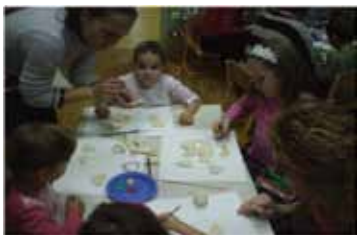
Izdelovanje okraskov za novoletno jelko

Konec leta je čas, ko se tako v vrtcu kot doma veliko dogaja. Za otroke, predvsem mlajše, je ta čas nekaj posebnega, pravljičnega, saj jih obiščejo kar trije dobri možje, ki jih obdarijo. V vrtcu otroke obišče dedek Mraz, ki z njimi preživi dopoldan. Otrokom prinese darila za celo skupino, da se lahko igrajo vsi. Hkrati se učijo deliti in skupaj igrati. Že na začetku šolskega leta smo se dogovorili, da potrebujemo za kakovostno delo nove televizije. Ker ni denarja, smo se dogovorili, da bomo zbirali papir, in starši so nam pridno pomagali. Denar, ki smo ga dobili od papirja, smo namenili za novi TV. Zbirali smo tudi donacije in tako nam je uspelo, da smo kupili dve veliki LCD-televiziji; eno za vrtec Kidričevo in eno za vrtec Cirkovce. Dedek Mraz jim je prinesel tudi koše za ločeno zbiranje odpadkov za vsako igralnico, kar smo potrebovali, saj smo v ekoprojektu, kjer imamo poudarek na ločenem zbiranju odpadkov. Seveda ni manjkalo sladkarij in piškotov, ki so jih otroci sami naredili s svojimi vzgojiteljicami. Tako smo vsi zadovoljni vstopili v novo leto.