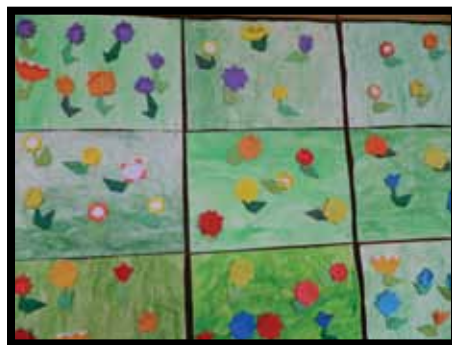
Učenci 2. a-razreda OŠ Borisa Kidriča Kidričevo