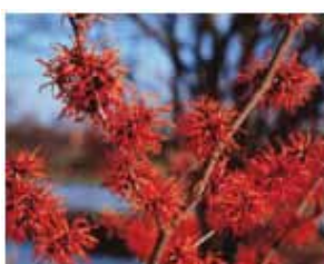
Sliki prikazujeta Zvito lesko levo in Nepozebo (Hamamelis) desno.

Sonce s svojim toplim objemom privabi izpod listja prve pomladne cvetlice. Tako se izpod grmov Hamamelisa na pogled pokažejo telohi v vsej svoji lepoti. Po travnikih in gozdovih se razprostirajo preproge belih zvončkov in po obronkih iz trave sramežljivo pokukajo vijolice in nežne rumene cvetlice – trobentice. Takšne, kot so jih poznale že naše babice, so obogatile hibridne vrste, ki se odražajo v vseh mogočih barvah in tudi oblikah. Razveseljujejo nas na vsakem koraku, ob vhodu, na terasah, v gredicah in v dnevni sobi.