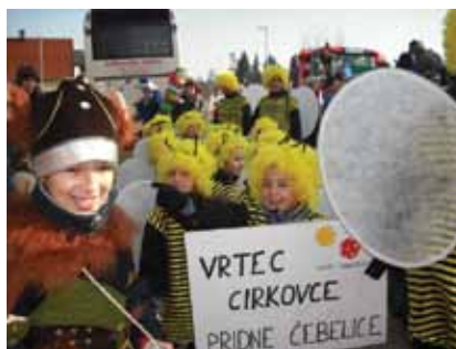
Pust v Cirkovcah

dan, 8. februar, namenili knjigi in brani besedi. Obiskali smo šolski knjižnici, ki sta mnogo večji od naše. Glede na sposobnost otrok so v knjižnicah pripravili posebne vsebine. Sposodili so si knjige, ki so jih brali in listali v igralnicah. Vsaka igralnica ima tudi knjižni kotiček, ki pa je manj založen in vanj prinašajo knjige tudi od doma. Po kulturnem tednu smo se že pridno pripravljali na pust. Starejši oddelki iz obeh enot so bili oblečeni v enotne kostume, ki so jih šivale pomočnice. V Kidričevem so bile »sončnice«, v Cirkovcah pa »čebelice«. Ti so se udeležili povork: otroške maškarade na Ptuj in »cirkovškega fašenka«. Tu sta obe skupini prejeli nagrado.